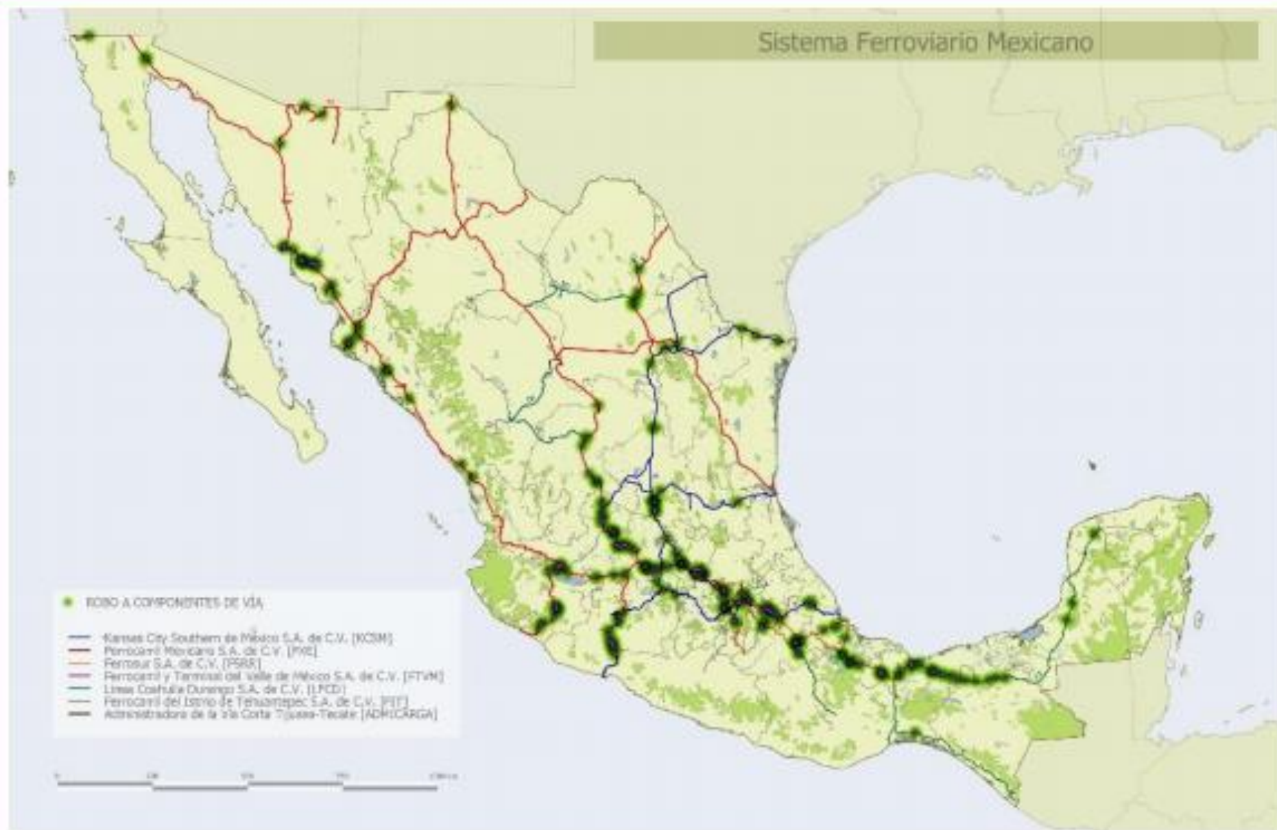
Figura 4. Ubicación Geográfica de Robo a Componentes de Vía